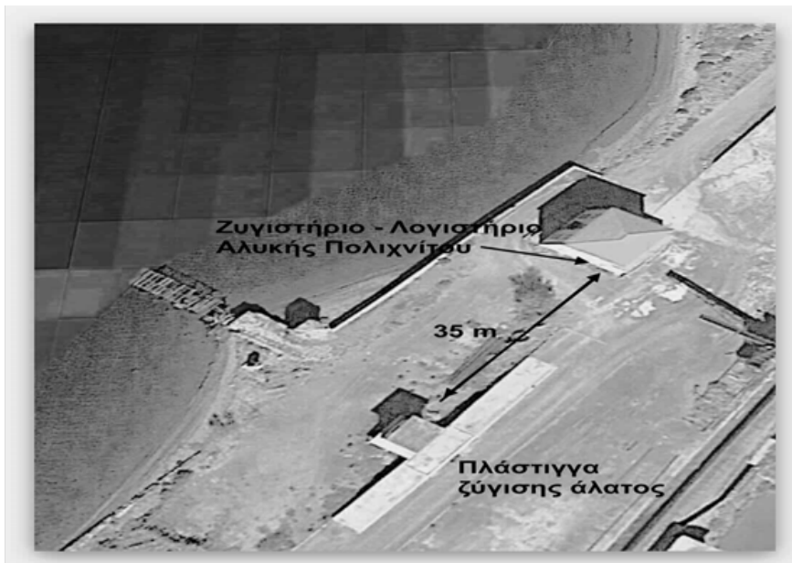
Θέση υφιστάμενης πλάστιγγας ζύγισης και λογιστηρίου – ζυγιστηρίου Αλυκής Πολιχνίτου.

Οι τρεις σύλοι – κάμερες, θα τοποθετηθούν στην διαθέσιμη πλευρά κάθε πλάστιγγας. Οι απαιτούμενες καλωδιώσεις θα οδεύουν υπεδάφια σε κατάλληλους χάνδακες.