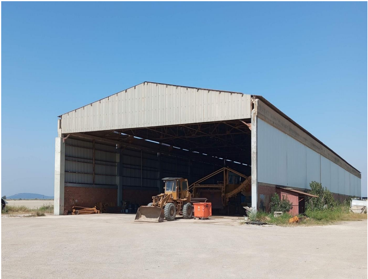
Άποψη του Υπόστεγου Οχημάτων (Εικ. 1).

Το υπόστεγο οχημάτων είναι ορθογωνικής διατομής διαστάσεων 106,94 * 21,50 μέτρων μέγιστου ύψους στέγης 13,10 μέτρων και ελάχιστου 9,05 μέτρων, κατά συνέπεια το ανάπτυγμα της στέγης είναι περίπου 2.353 τετραγωνικά μέτρα . Ο φορέας του κτιρίου αποτελείται από υποστυλώματα οπλισμένου σκυροδέματος διαστάσεων 0,30 * 0,40 μέτρων. Η επικάλυψη αποτελείται από φύλλα τραπεζοειδούς λαμαρίνας, τα οποία λόγω της παλαιότητας και των διαβρωτικών συνθηκών που επικρατούν στην αλυκή, χρήζουν αντικατάστασης.